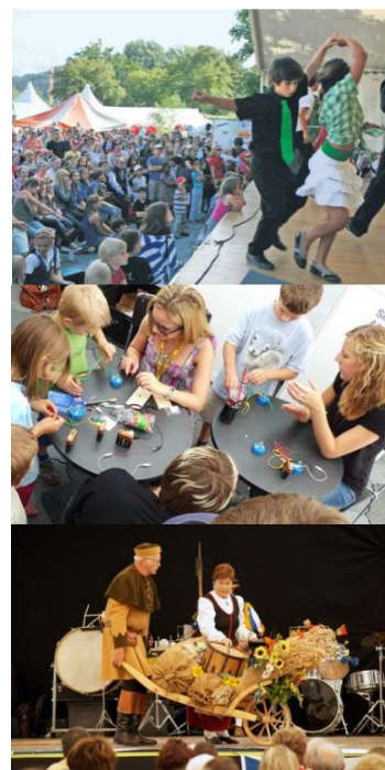
Das Festareal ist zentral gelegen im Kreis9 und gut erreichbar.